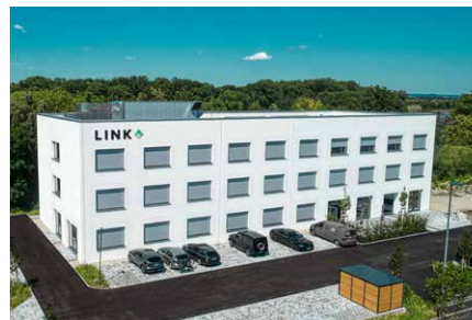
LINK Das Gründerzentrum Landshut Kiem-Pauli-Straße 8 | 84036 Landshut www.link-landshut.de