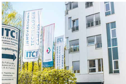
ITC1 Deggendorf Technologie orientierter Gewerbepark und digitales Gründerzentrum Ulrichsberger Str. 17 | 94469 Deggendorf www.itc-deggendorf.de