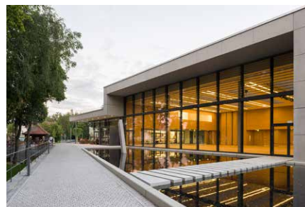
Schwarzachtalhalle Neunburg vorm Wald Rötzer Straße 2 | 92431 Neunburg v. Wald www.neunburgvormwald.de