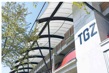
Technologie- und Gründerzentrum Straubing-Sand Europaring 4 | 94315 Straubing www.tgz-straubing.de